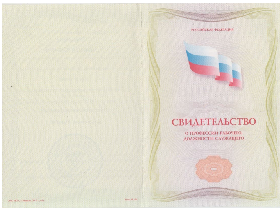
Рисунок 2 - Пример титула бланка свидетельства о профессии рабочего, должности служащего