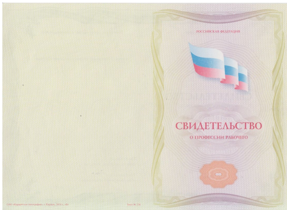
Рисунок 1 - Пример титула бланка свидетельства о профессии рабочего