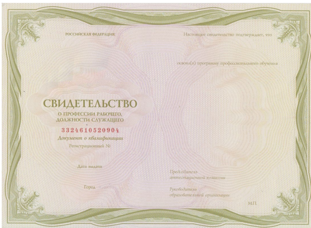
Рисунок 3 - Пример бланка свидетельства о профессии рабочего, должности служащего