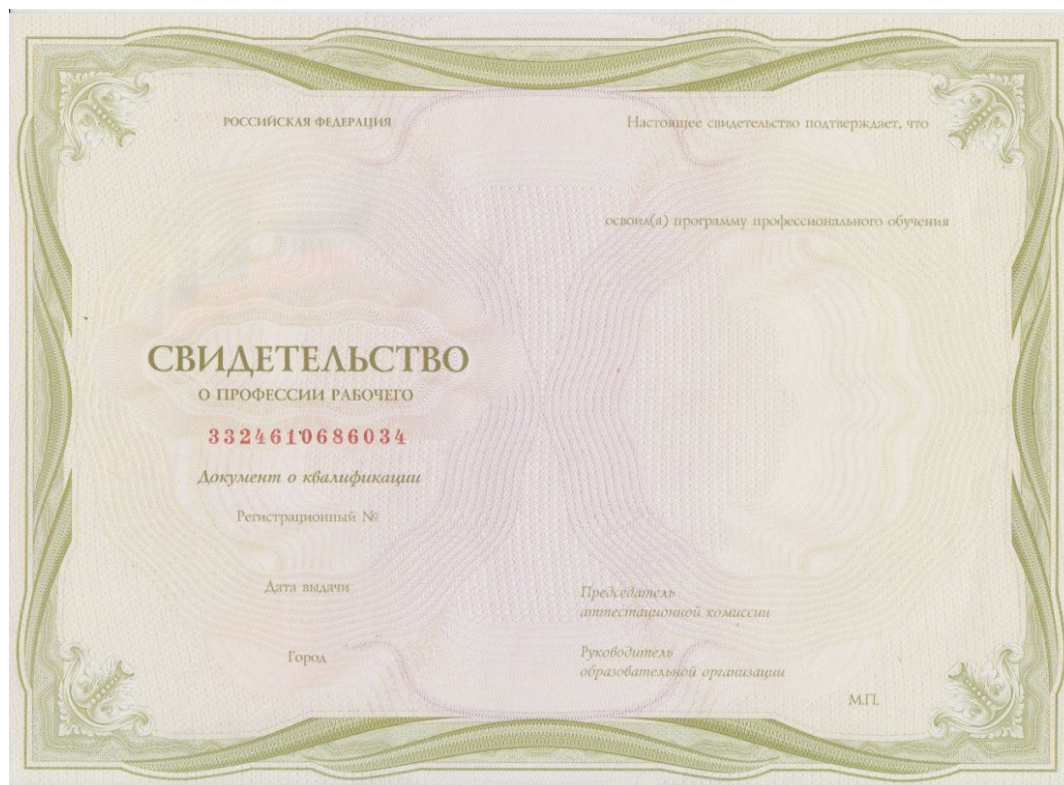
Рисунок 4 - Пример бланка свидетельства о профессии рабочего