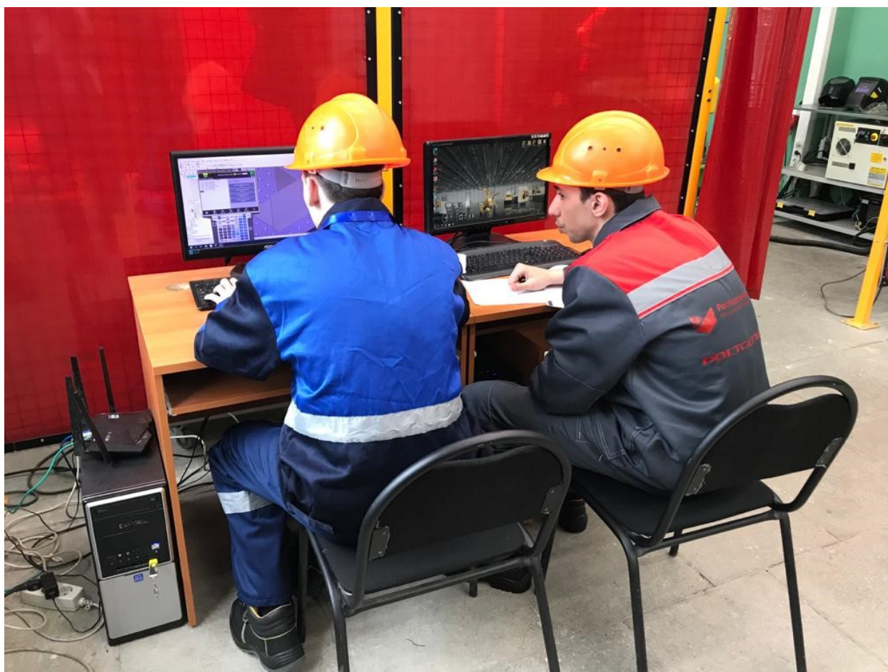
Программирование процесса сварки в Roboguide